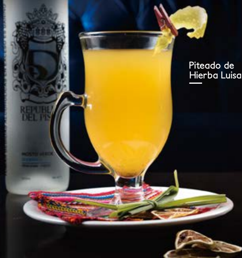
Piteado de Hierba Luisa