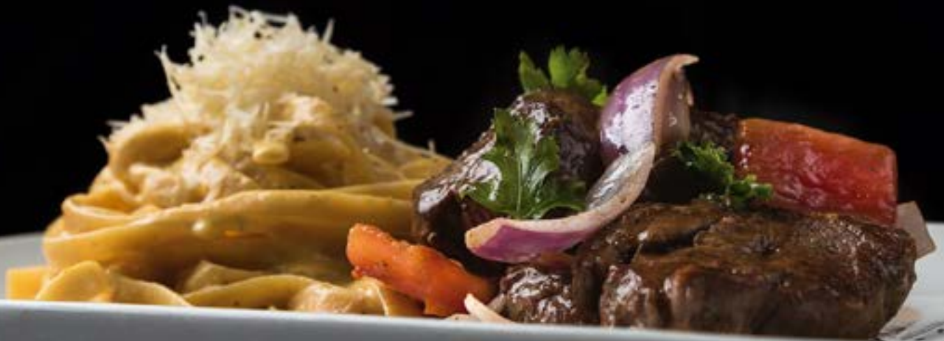
Fettuccini a la Huancaína con Lomo