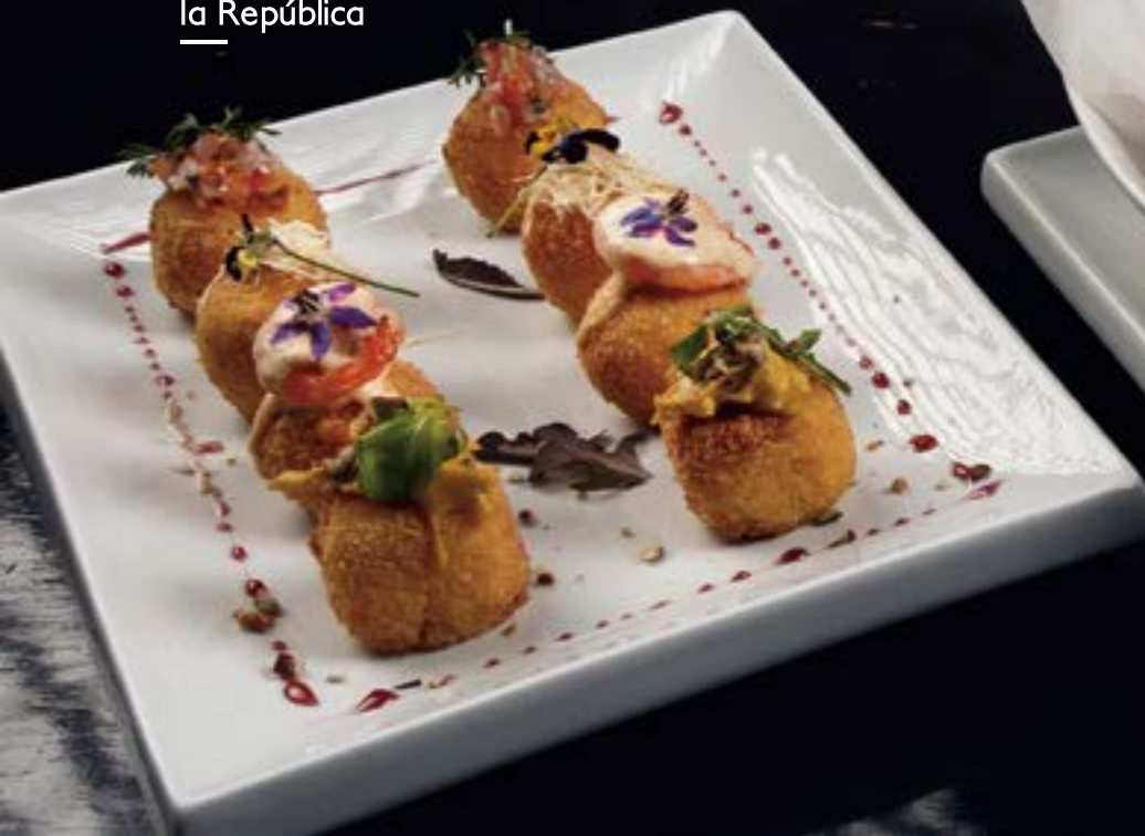
Croquetas de la República