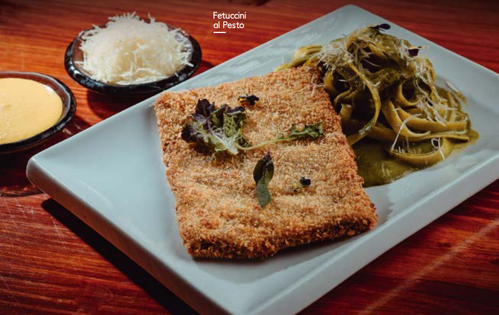
Fetuccini al Pesto