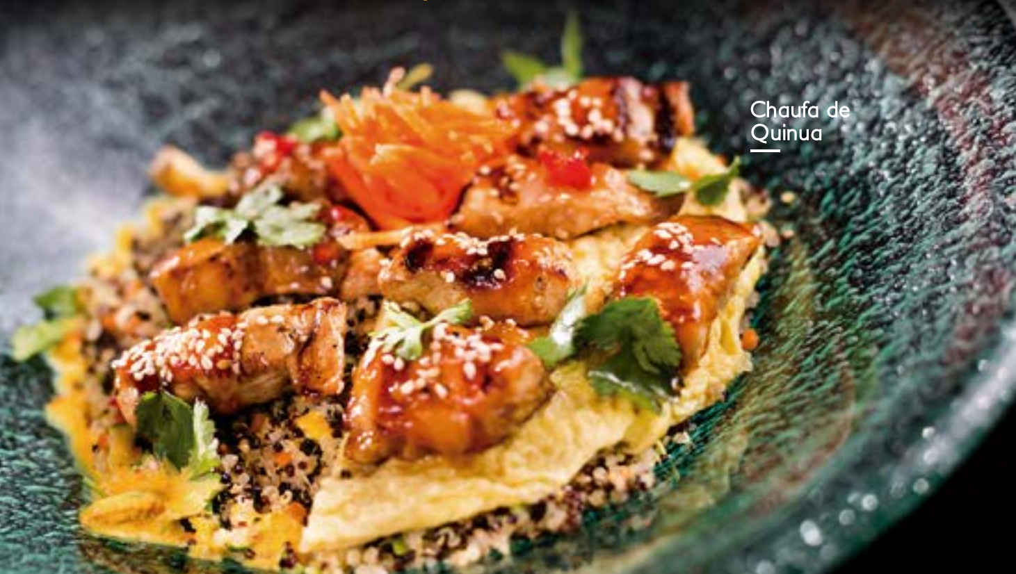
Chaufa de Quinoa