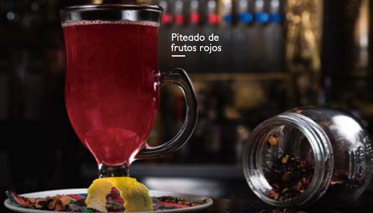
Piteado de frutos rojos